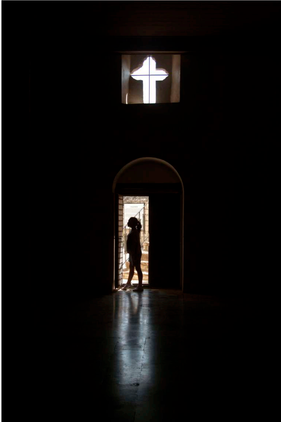
Serpil Seçkin TEKELİ